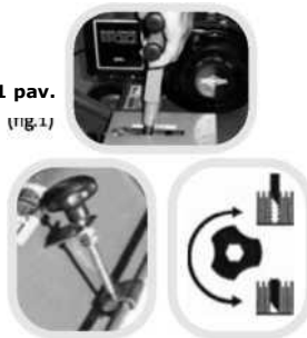
1 pav. (1/10, 1)

Pastaba: peiliai turi smigti į žemę per maždaug 5 mm.